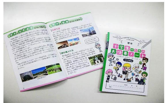
(寄贈いただいた堺市子どものお仕事ノート)