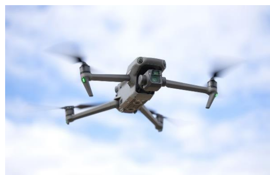
業務用ドローン「Mavic3（マビックスリー）」