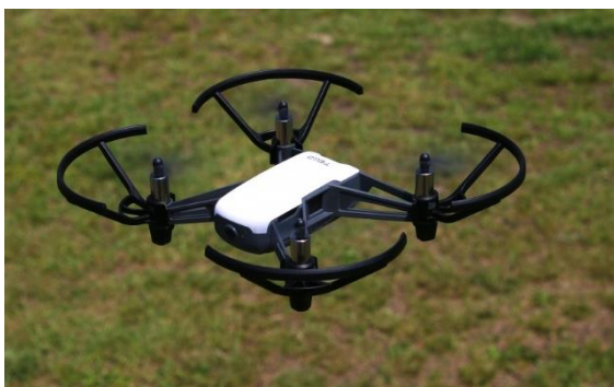
小型ドローン「Tello（テロー）」

（※）プログラミング的思考…自分が意図する一連の活動を実現するために、どのような動きの組合せが必要であり、一つ一つの動きに対応した記号を、どのように組み合わせたらいいのか、記号の組合せをどのように改善していけば、より意図した活動に近づくのか、といったことを論理的に考えていく力。