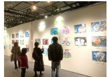
昨年度の作品展・小学生絵画展の様子