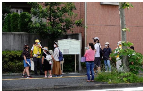
【子どもたちが茶の湯に関する体験ツアーに参加】