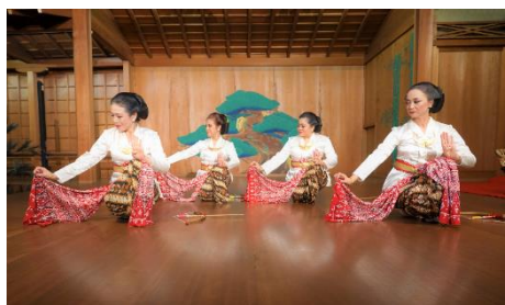
【能舞台でジャワ舞踊とガムラン音楽を披露】