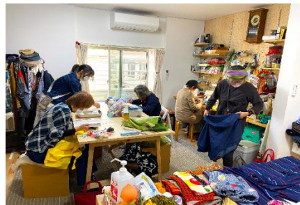
【障害者作業所でユーズド衣料をアップサイクル】