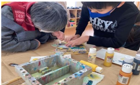
【障害者支援施設での造形ワークショップに子どもたちが参加】