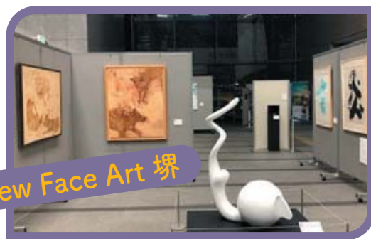
New Face Art 堺