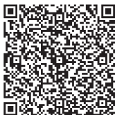
堺市電子申請システム

https://lgpos.task-asp.net/cu/271403/ea/residents/procedures/apply/57eb174b-f012-47bb-89c7-c825292ccbbe/start