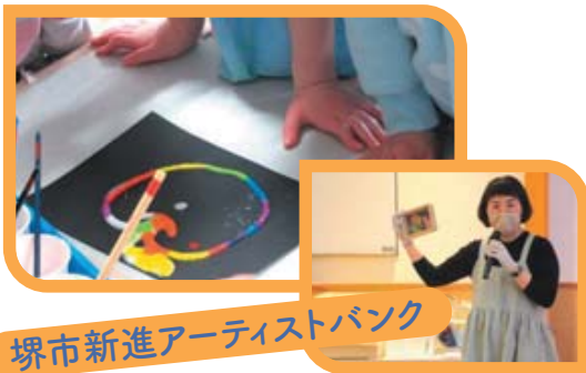
堺市新進アーティストバンク