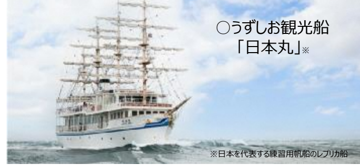
○うずしお観光船「日本丸」※