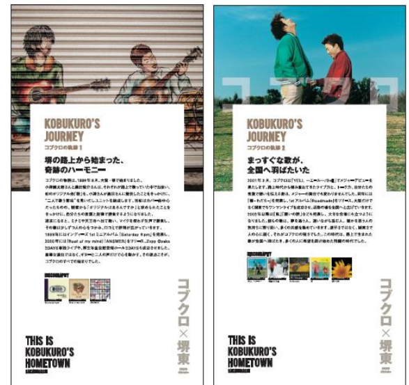
④コブクロ軌跡バナー（一部）