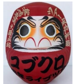
③「KOBUKURO LIVE TOUR 2025 “THIS IS MY HOMETOWN”」成功祈願だるま