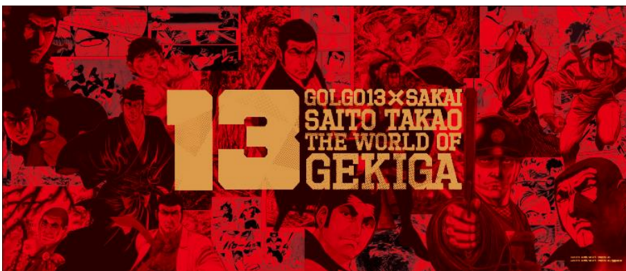
©さいとう・たかを / さいとう・プロダクション ©さいとう・たかを / さいとう・プロダクション / 池波正太郎