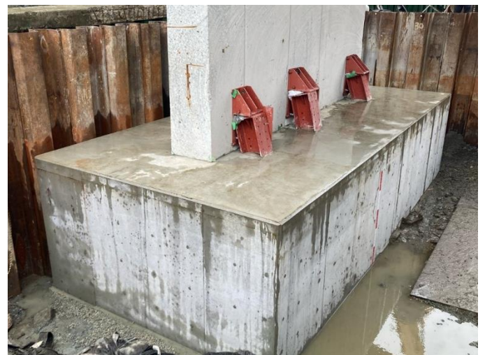
コンクリートによる本体補強 （4 月 24 日撮影）