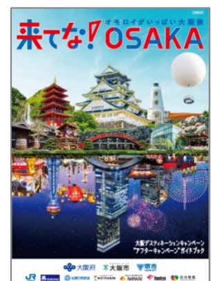
大阪アフターDC 公式ガイドブック