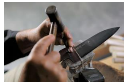
名入れ風景イメージ

創業 221 年の歴史で培われた堺刀司の職人によるレクチャーで、長く愛用できるマイ庖丁を作る体験です。