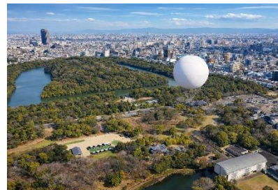
おおさか堺バルーンと仁徳天皇陵古墳

上空約 100mから仁徳天皇陵古墳をはじめとした世界遺産・百舌鳥古墳群や堺の街並みを眺望し、歴史的な価値や雄大さ等の魅力を体感してください。都市部における日本唯一のヘリウム型気球から 360 度の眺望を楽しんでいただけます。