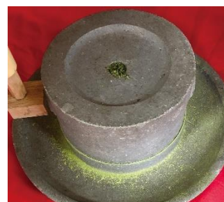
石臼での抹茶づくり体験イメージ

安政元（1854）年創業の「西尾茗香園茶舗」で、石臼での抹茶づくりを体験し、挽いた抹茶をご自身で点てて召し上がっていただけます。最後には煎茶のおいしい淹れ方のレクチャーもあり、期間限定で抹茶チョコをプレゼントします。