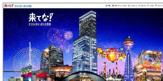
「来てな！オモロイがいっぱい大阪旅」公式サイト