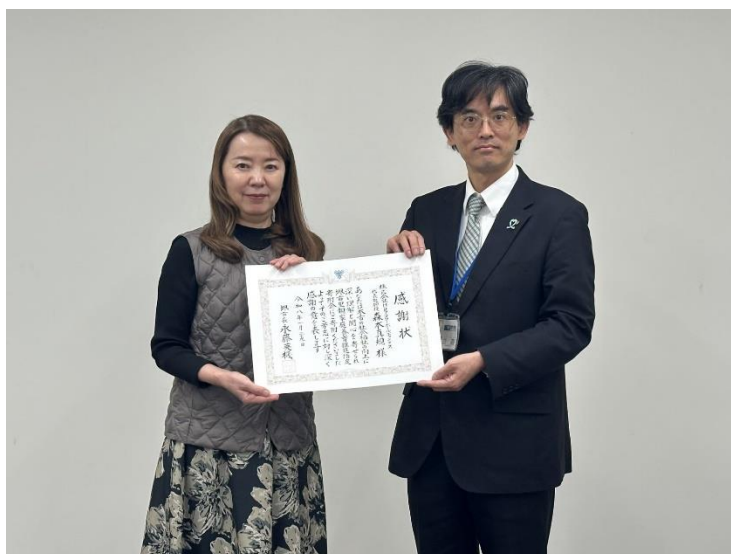
左から森本代表取締役社長、立道子ども家庭課長