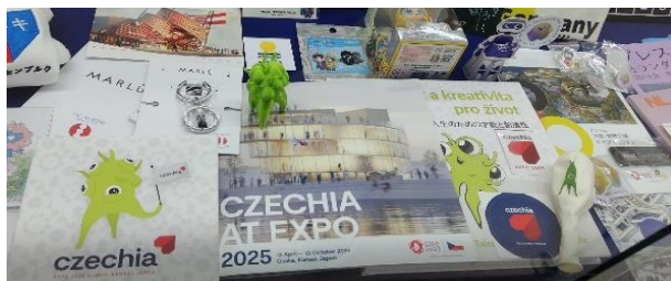
パビリオンの関連グッズ