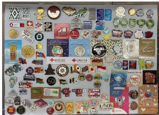
公式参加国や各パビリオンのピンバッジ