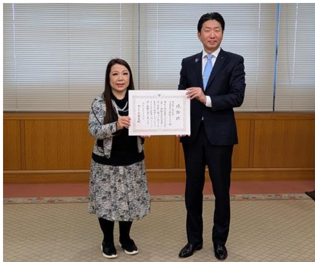
左から、呉松代表取締役社長、永藤市長