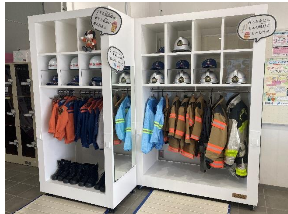
こども制服用ハンガーラック