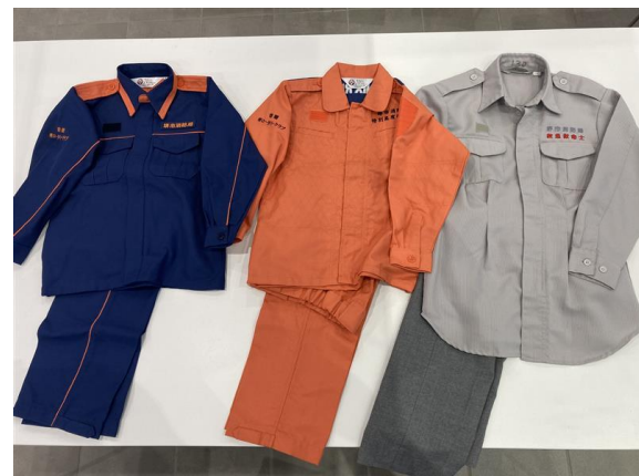
こども制服各種（防火服・冬制服・活動服・救助服・救急服）