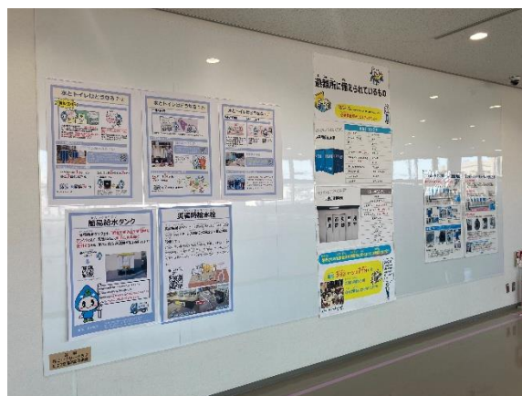
壁面マグネットパネル