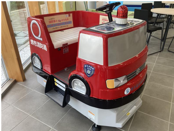
バッテリー式定置消防車