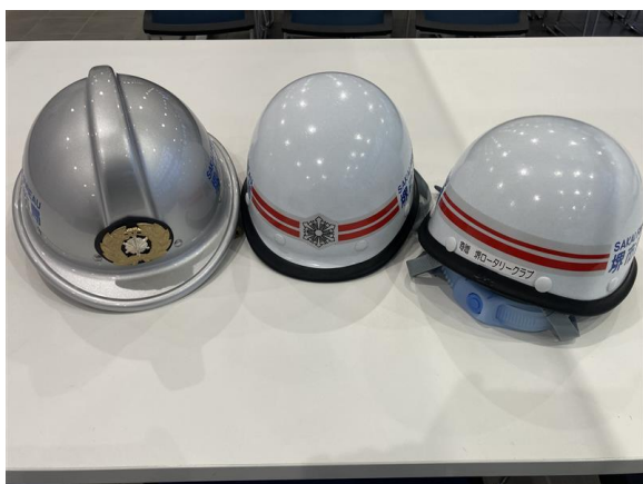
こども用ヘルメット（防火帽・保安帽）