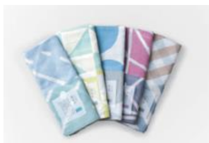
(※4) hirali ガーゼストール 〔竹野染工 (株) 〕