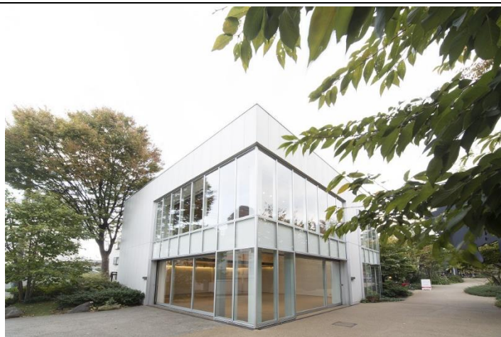
DAIKANYAMA T-SITE GARDEN GALLERY