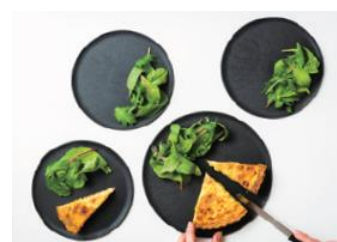
(※3) CHOPLATE 〔(株) 河辺商会〕