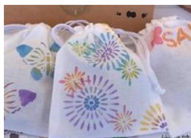
(※5) いぐさの香り袋 〔大江畳〕