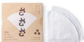
(※1) さささ 和晒コーヒーフィルター 〔(株) 武田晒工場〕