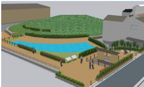
御廟表塚古墳（完成イメージ）