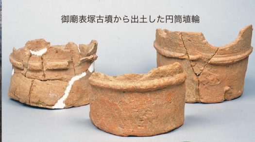
御廟表塚古墳から出土した円筒埴輪