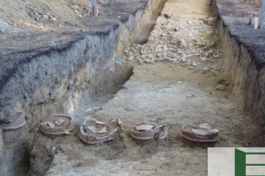
御廟表塚古墳の埴輪列と墓石