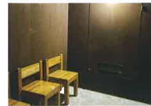
ぜんたい ああ つばちなみまいふん ていと 全体の大きさは1坪 (畳2枚分) 程度