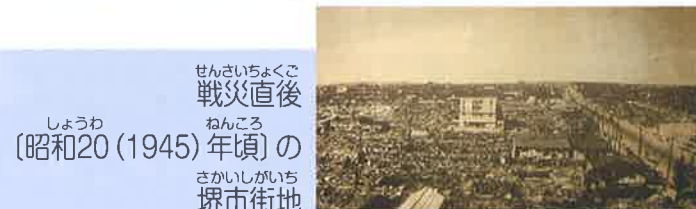
せんさいちやくご 戦災直後 しょうわ ねんころ 〔昭和20 (1945) 年頃〕の 堺市街地