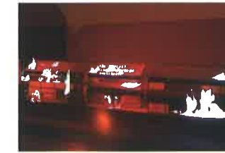
さいたいくうしやう ようす えいそう さいげん 堺大空襲の様子を映像で再現します