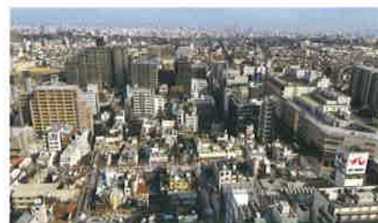
げんざい れいわ ねん 現在 (令和3 (2021) 年) の 堺市街地