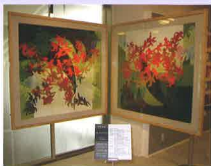
たしまゆきひこ さく 「あしたの子ども」