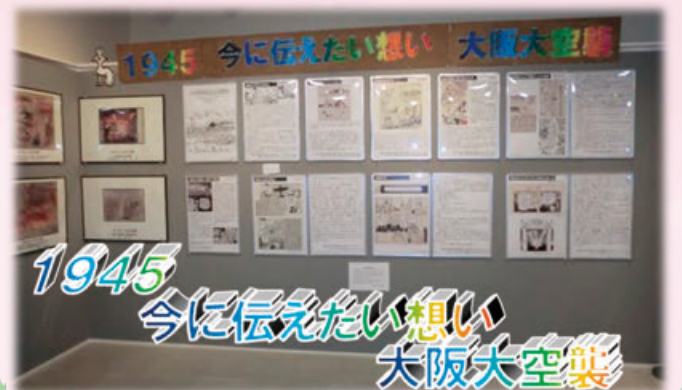
1945 今に伝えたい思い 大阪大空襲

太平洋戦争時、大阪で生活されていた方々は「大阪大空襲」で何を見て、何を思っ暮らしていたのか。今回の企画展ではピースおおさかに収蔵されている太平洋戦争時の「体験画」や「マンガ」を通して声にならない過酷な環境や、平和への思いを伝えます。