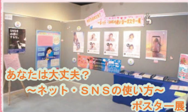
あなたは大丈夫？ ～ネット・SNSの使い方～ ポスター展

今、私たちにとって、欠かせないツールとなったインターネット。しかし、便利なその一方で、多くの人権侵害も起きています。今回の企画展では私たちが被害者にも加害者にもならないために、SNSの利用にかかる注意を促すことを目的に、地方公共団体等が作成したポスターを展示しました。