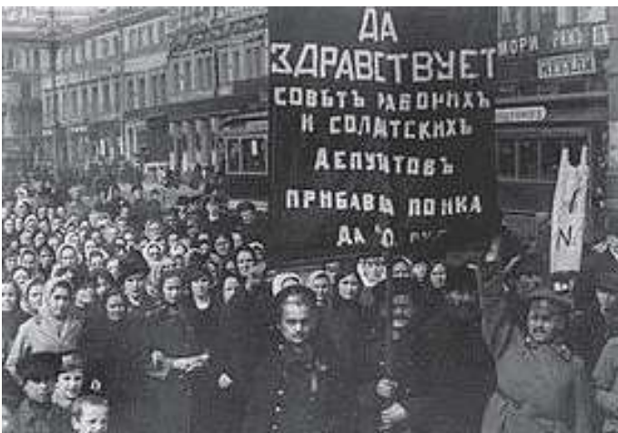
ねん がつ こうぎ 1917年2月 抗議デモ

とうじ もち れき かくめいぼつぱつび にち かざん ※当時ロシアで用いられていたユリウス暦における革命勃発日。13日を加算すると、 けんざい いっばんてき もち れき かんざん 現在一般的に用いられるグレゴリオ暦に換算できる。