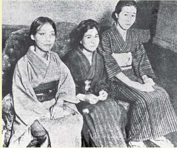
しゃかいしゆぎだんたい 社会主義団体のメンバー

そこでは、女性の「政治的・社会的・経済的自由」を訴える演説会が おこな 行われました。