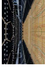
大浜だいしんアリーナ