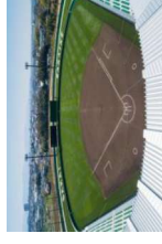
くら寿司スタジアム堺