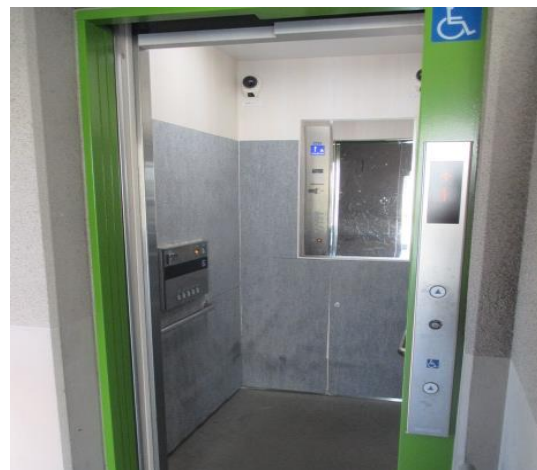
公営住宅等ストック総合改善事業 今池住宅D棟エレベーター更新工事