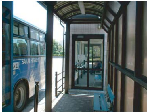
(バス乗り場③) ○点字、音声誘導設備の設置・改良