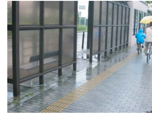
(大阪和泉泉南線からのバス停入り口) ○点字、音声誘導設備の設置・改良