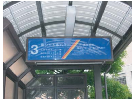
(バス乗り場の案内表示)