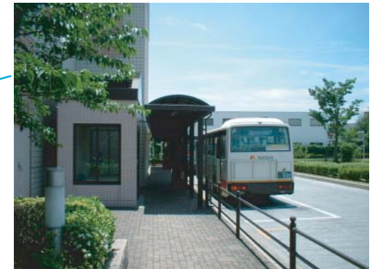
(バス乗り場①②) ○施設までの案内誘導設備の設置