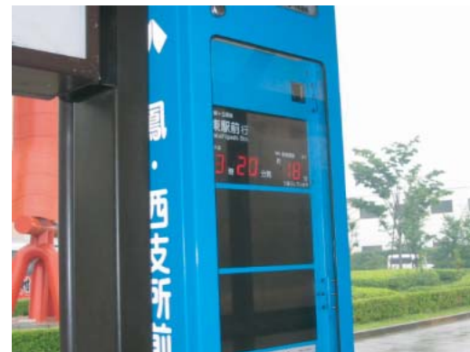
(バス乗り場の案内表示) ○点字、音声誘導設備の設置・改良