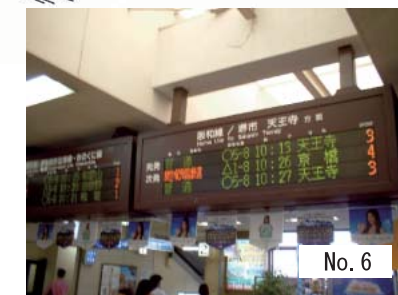
6 : 案内表示