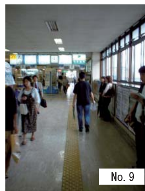
9 : 改札外通路