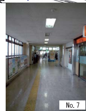
7 : 改札内通路