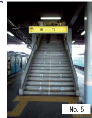
5 : ホームへの階段