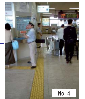
4 : 改札口