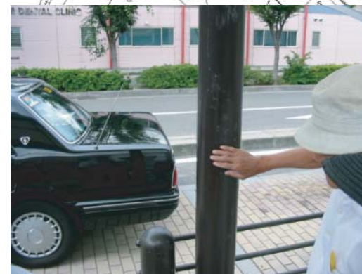
(タクシー乗り場) ○点字、音声誘導設備の設置・改良