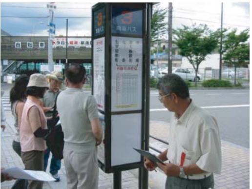
(バス降り場) ○点字、音声誘導設備の設置・改良