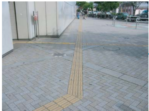
(誘導ブロックと舗装面)