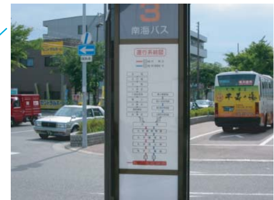
(バス乗り場) ○点字、音声誘導設備の設置・改良