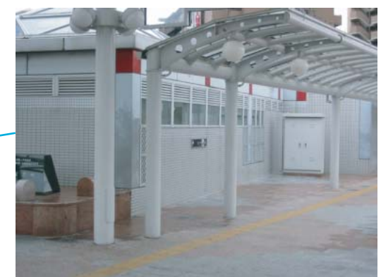
(地下へのエレベーターへの案内表示)