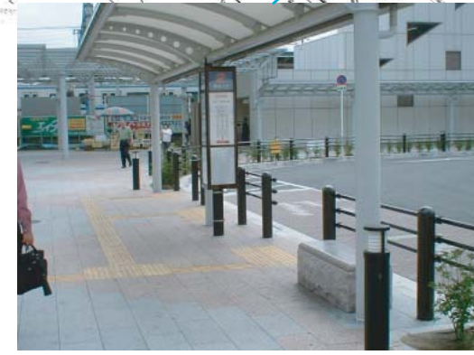
(バス乗り場②) ○点字、音声誘導設備の設置・改良