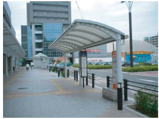
(バス乗り場①) ○点字、音声誘導設備の設置・改良