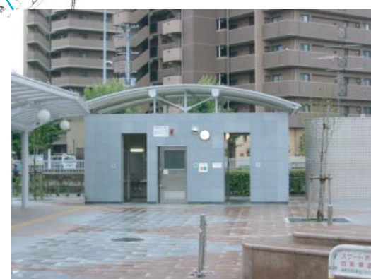
(多機能型トイレ) ○点字、音声誘導設備の設置・改良