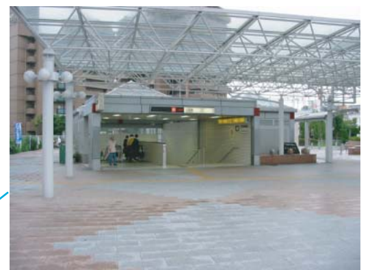
(地下鉄駅への連絡通路)