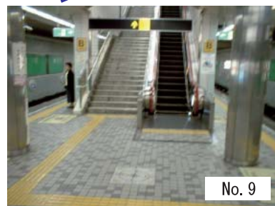
9 : エスカレーター (改札内)