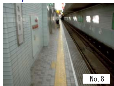
8 : プラットホーム