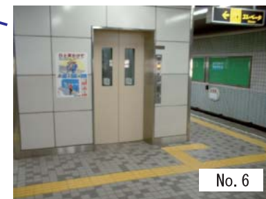
6 : エレベーター (改札内)