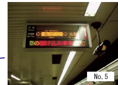
5 : 案内表示