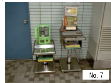
7 : 車いす対応型電話