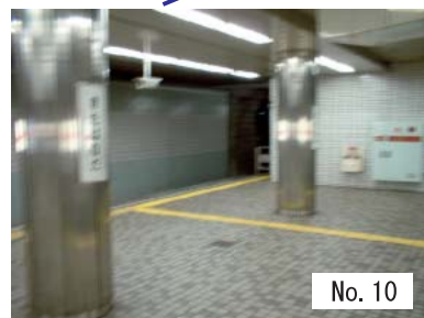
10 : 転落防止柵