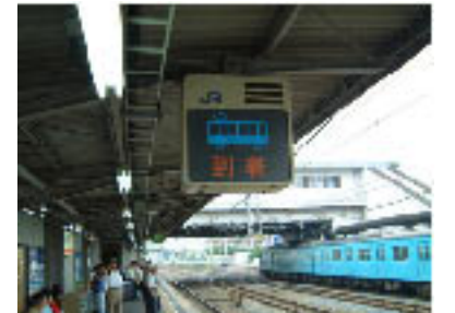
No.9 ホーム上の電光表示（入線案内）