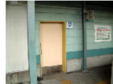
No.9 障害者用トイレ(なんば方プラットフォーム)