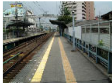
No.13 プラットホーム上のトイレの誘導ブロック