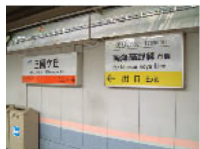
No.12 プラットホーム上の案内表示

○障害者対応の多機能型トイレの設置 ○主要施設等への案内表示の改良 ○誘導・警告ブロック敷設位置等の改良 ○点字誘導設備の設置・改良