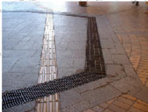
○スロープ前のグレーチングの改良