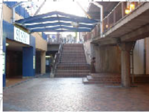
○エレベーター等の設置