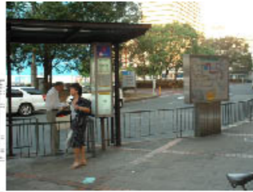
○路線図・料金表等の改良 ○バス関連施設の設置・改良