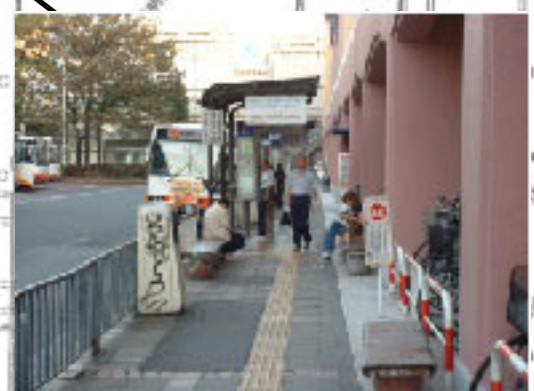
○バス関連施設の設置・改良