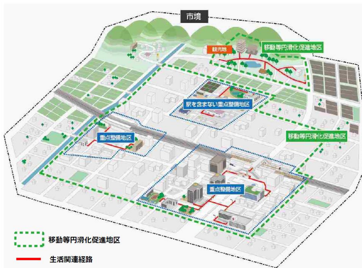
マスタープラン・基本構想のイメージ図