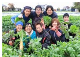
露地栽培による障害者雇用農園(茨城県つくば市)

保全すべきとされた都市農地に対し、本格的な農業振興施策が講じられるよう方針を転換