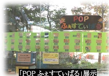
「POP ふえすていばる」展示

・ POPは82点の応募があり、館内に掲示してベスト POP を募ったところ215枚の投票がありました。投票の結果及び多くの投票を集めたPOPは、図書館ホームページに掲載しました。展示期間中は中高生や、教諭の姿も見られ、来館機会の創出につながりました。