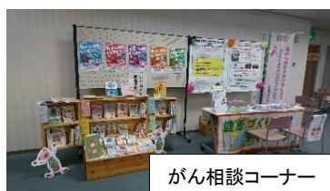
がん相談コーナー