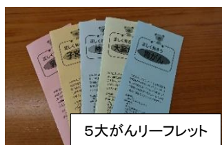
5大がんリーフレット