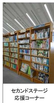
セカンドステージ 応援コーナー