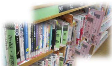
ティーンズエリア書架見出し

・ 中高生が気軽に足を運べるようティーンズエリア内に、親しみやすいイラストや看板を新たに設置し、若年層が居心地よく思える雰囲気を作りました。あわせて教科にあわせた書架見出しを設置し、本の表紙を展示することで、よりわかりやすくなる工夫を行いました。また、館内に、発達障害等を持つ方の行動についての理解を求める啓発ポスターを掲示し、安心して利用できる環境づくりに取組みました。