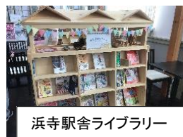
浜寺駅舎ライブラリー