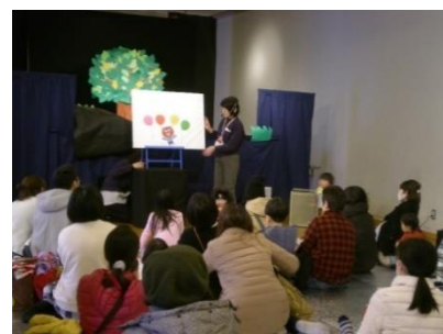
▲ボランティアによる実演

・課題解決支援講座「もしかして認知症？～正しく知るために」を2月17日に開催しました。市民の関心も高く、講座は定員を超える申し込みがありました（42人/40人）。区内認知症疾患医療センターの認定看護師による講演のほか、相談窓口となる包括支援センターの紹介やパネル展示、関係書籍の展示、講座後には個別相談の時間を設けるなど充実した内容で参加者からも好評を得ました。また、当講座の開催に合わせ、図書館利用促進のPRチラシを区役所内の関係部署などに配布しました。