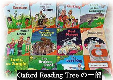
Oxford Reading Tree の一部

・ 地域資料コーナーでは、これまで書庫にあった『堺市史』をすぐに手に取れるよう開架しました。あわせて松原、富田林、河内長野各市の市史及びみはら歴史博物館の図録等も新たに収集しました。また、基本構想基礎調査回答や 2020 年度から小学校で英語が教科化されることをふまえ、これまで本市で未所蔵であった子ども向け英語テキスト「Oxford Reading Tree」を購入しました。