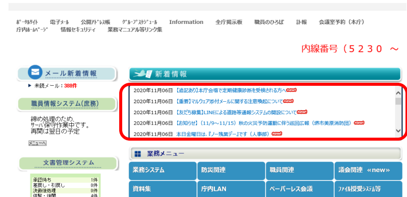
(庁内向けポータルサイト)