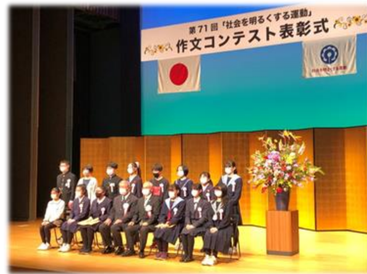
作文コンテスト表彰式の様子 (令和4年1月14日@フェニーチェ堺小ホール)