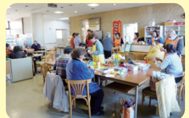
【堺ぬくもりカフェ（認知症カフェ）】