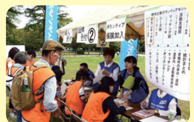
【災害ボランティアセンター開設訓練】