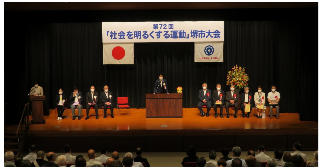
第72回「社会を明るくする運動」堺市大会 (令和4年7月4日@堺市総合福祉会館ホール)