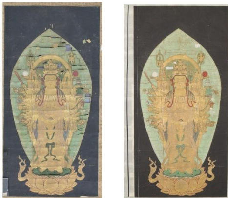
千手観音像 （左・保存処理前、右・保存処理後）