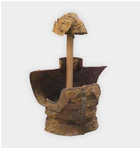
大塚山古墳出土襟付短甲（保存処理前）