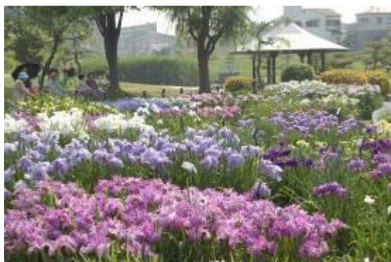
白 鷺 公 園

東区は、市域の中央東部に位置し、南部は大阪狭山市と隣接しています。昭和 30 年代に南河内郡南八下村、日置荘町、登美丘町が、順次、本市に編入され、現在の東区域となりました。