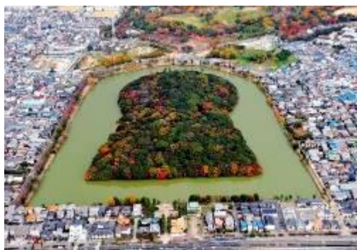
世界文化遺産登録された 履中天皇陵古墳

西区は、人口約 1 3 万 2 千人、世帯数約 6 万世帯で、市域の西部に位置し、区域の西には大阪湾が広がっています。南西部は高石市、和泉市と接しており、南海線、阪和線、阪堺線の鉄軌道や阪神高速道路 4 号湾岸線、国道 2 6 号などの幹線道路が整備されています。