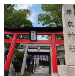
華表神社（長尾街道沿い）