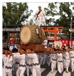
金岡町盆踊り大会