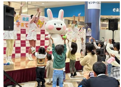
子育て世帯と地域の支援者の 交流を図る子育てフェスタ