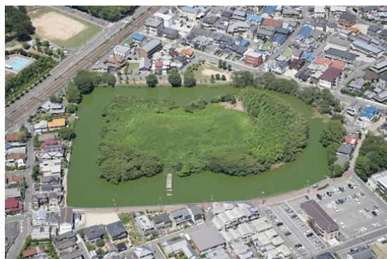
地域の方々の想いで守られた「いたすけ古墳」

北区は、人口約 15 万 7 千人、世帯数約 7 万世帯で、北は大和川を隔てて大阪市、東は松原市に接し、J R 阪和線、南海高野線、大阪メトロ御堂筋線の鉄道、大阪中央環状線などの幹線道路が整備されています。