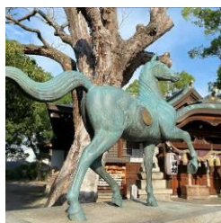
金岡神社（竹内街道沿い）

北区には、世界遺産「百舌鳥・古市古墳群」の構成資産である「御廟山古墳」、「いたすけ古墳」、「ニサンザイ古墳」、「善右エ門山古墳」などの古墳があり、「竹内街道」「西高野街道」「長尾街道」の三街道が通り、街道沿いには名所旧跡が点在しています。他にも、百舌鳥八幡宮のふとん太鼓、金岡町盆踊り大会などの伝統行事、大和川や農地などの自然といた、多くの資源があります。