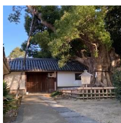
筒井家住宅（西高野街道沿い）