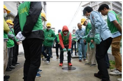
各校区で実施される 防災訓練