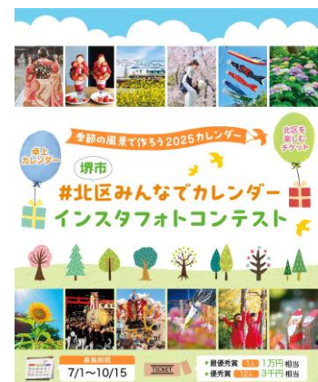
皆さんから教えてもらった 北区の魅力を拡散