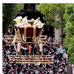
百舌鳥八幡宮のふとん太鼓