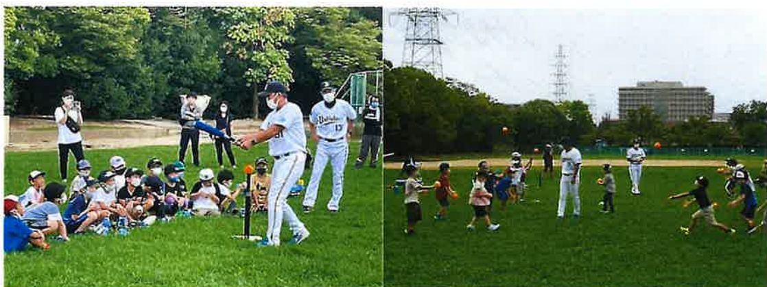
オリックス・バファローズ野球教室