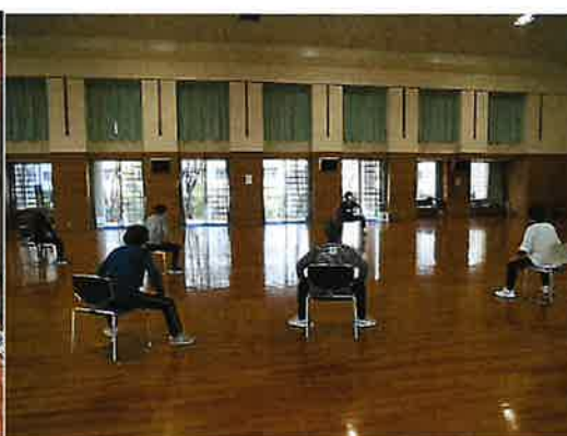
わくわく体操 (金岡)