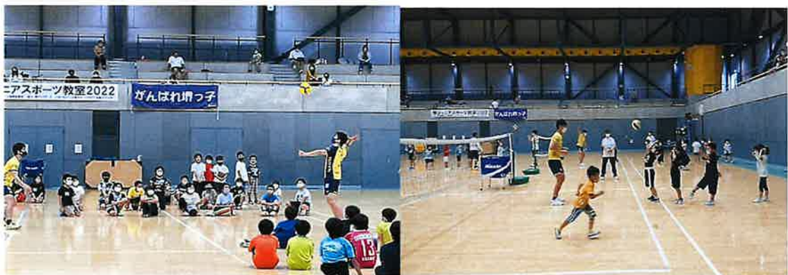
堺ジュニアスポーツ教室