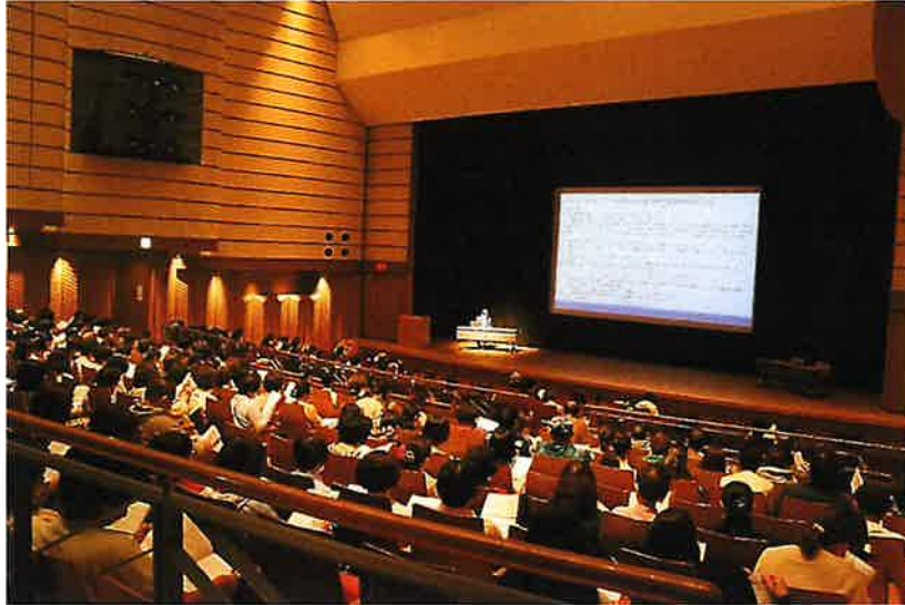
(令和4年10月6日 指導員基礎研修会の様子)