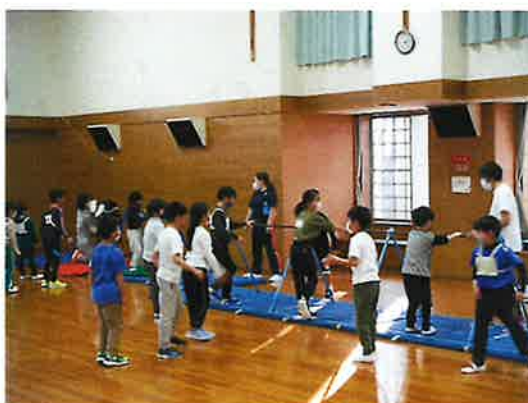
ジュニアスポーツ (金岡)