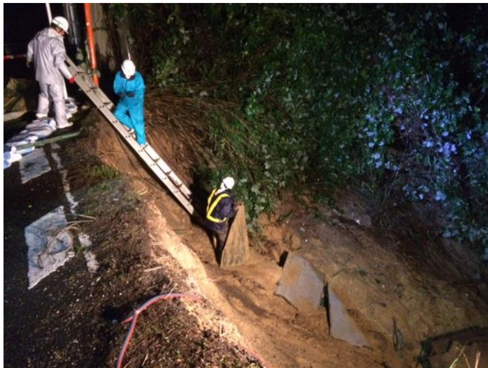
府道富田林泉大津線 道路下法面崩れ（南区）