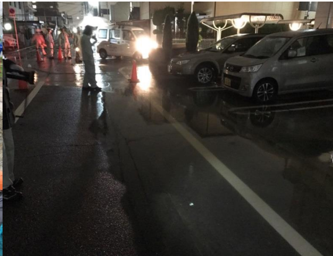
常磐町内下水流出状況