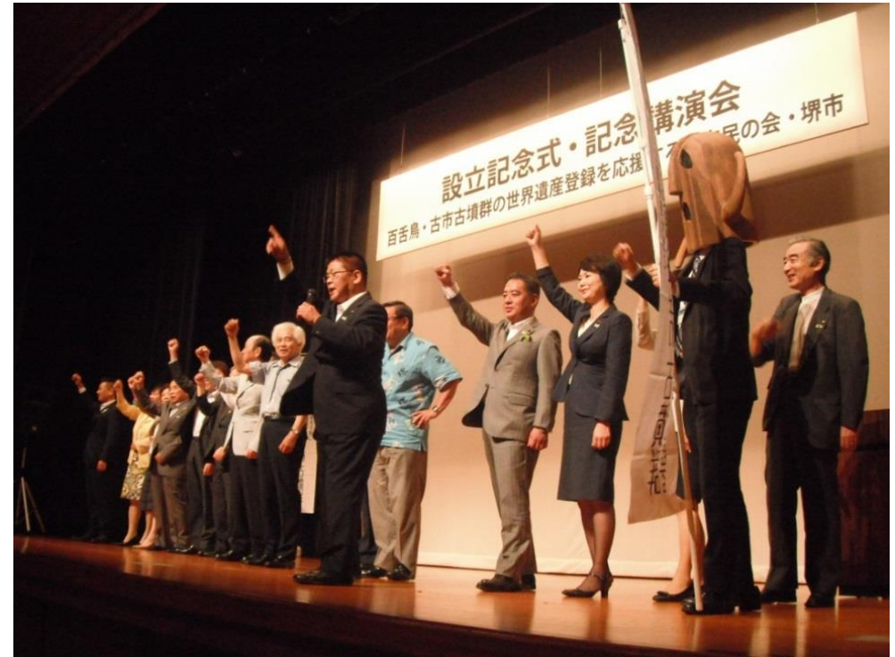
「百舌鳥・古市古墳群の世界遺産登録を応援する堺市民の会」設立記念式