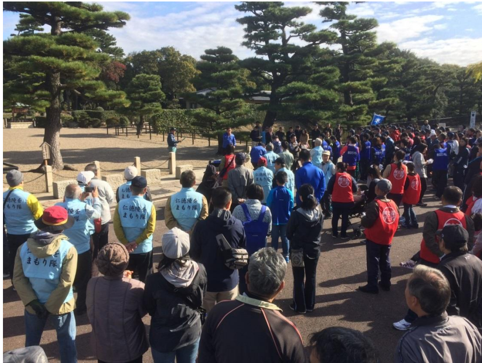
古墳の清掃活動の様子