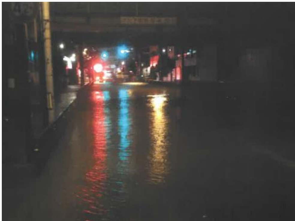
府道大堀境線 冠水状況（堺区・北区）