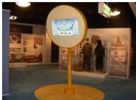
平和と人権資料館