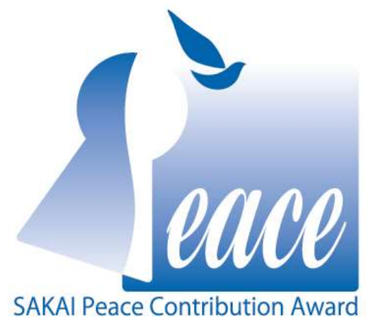
自由都市・堺 平和貢献賞シンボルマーク

国内の学識経験者、有識者、大学、研究機関等に候補団体の推薦を依頼。推薦された候補団体を有識者で構成された選考委員会に諮り、その意見を踏まえ、市長が授賞団体を決定。