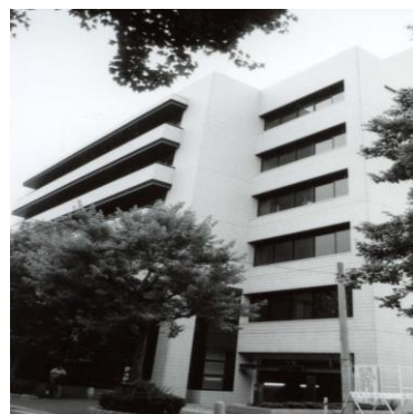
堺市総合福祉会館