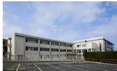
重度障害者歯科診療所

所在地 堺区大仙中町18-3 電話番号 243-4488 敷地面積 4,044.5m 2 建築面積 580.4m 2 延床面積 1,610.1m 2 構造 鉄筋コンクリート造 地上3階 開設年月日 平成20年4月1日