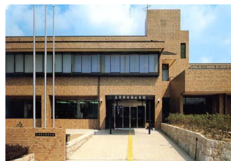
美原総合福祉会館