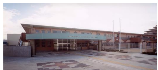
北こどもリハビリテーションセンター

所在地 西区上野芝町2-4-1 電話番号 279-0500 敷地面積 6,609m 2 開設年月日 平成15年4月1日