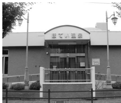
共 同 浴 場