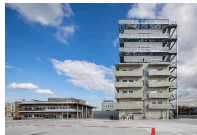
総合防災センター (総合訓練棟)