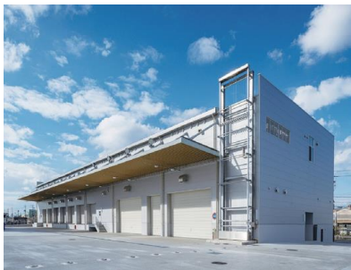
総合防災センター (災害活動支援棟)