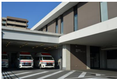
救急ワークステーション (堺市総合医療センター内)