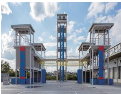
総合防災センター (救助訓練棟)