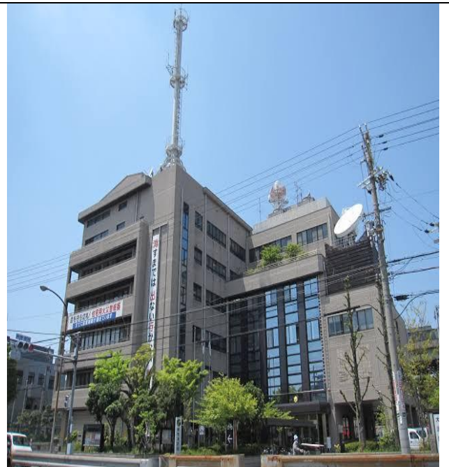
消 防 局

また、令和3年4月1日から大阪狭山市の消防事務が堺市に委託され、1消防本部、9消防署、9出張所、1分署となった。