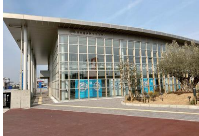
総合防災センター (防災啓発施設)