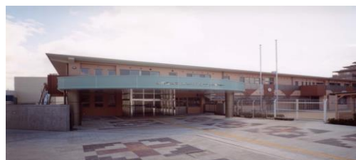
北こどもリハビリテーションセンター

所在地 西区上野芝町2-4-1 電話番号 279-0500 敷地面積 6,609㎡ 開設年月日 平成15年4月1日