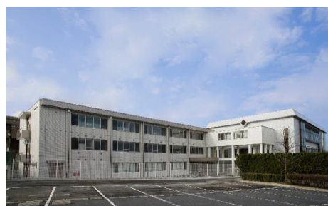
重度障害者歯科診療所