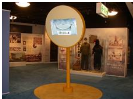
平和と人権資料館