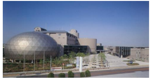
教育文化センター（ソフィア・堺）