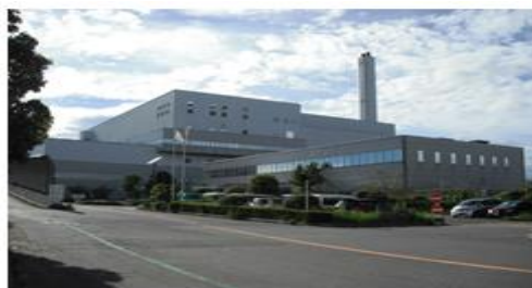
クリーンセンター東工場第二工場