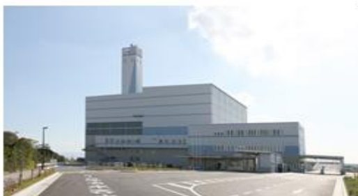
クリーンセンター臨海工場