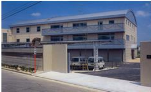
リサイクルプラザ