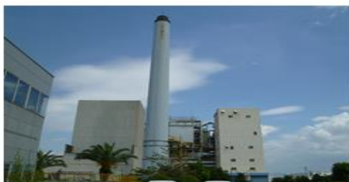
クリーンセンター東工場第一工場