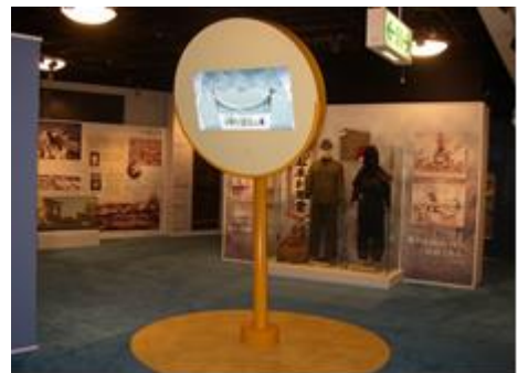
平和と人権資料館