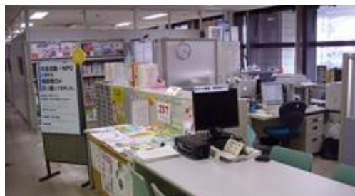
市民活動コーナー

本市における市民活動の促進を図ることを目的として、NPO法人や市民活動団体等を支援するための施設を設置している。